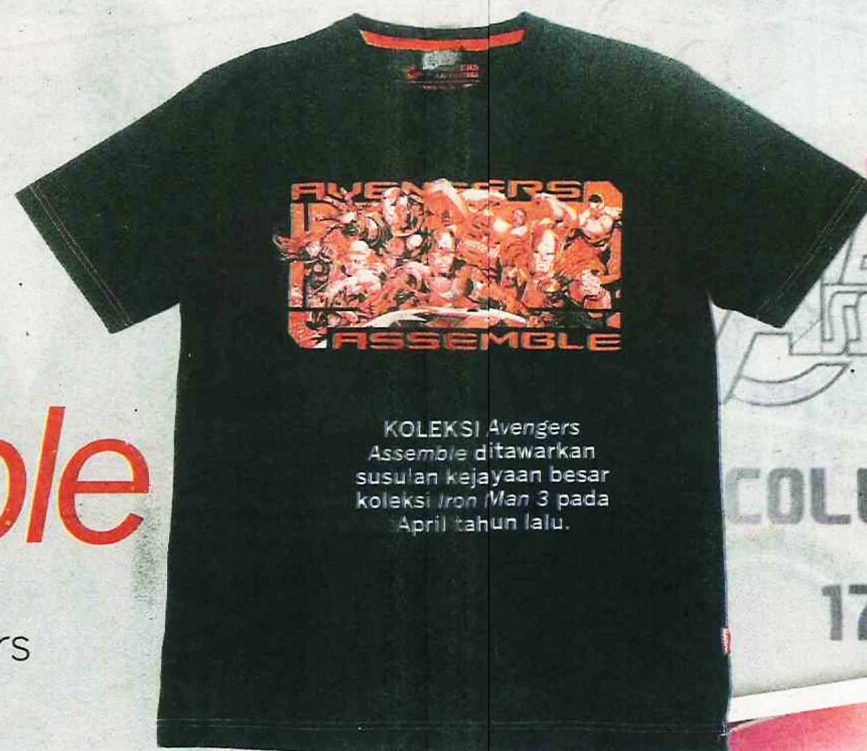
KOLEKSI Avengers Assemble ditawarkan susulan kejayaan besar koleksi Iron Man 3 pada April tahun lalu.

PADANAN baju-T kolar bulat dengan seluar pendek berwarna merah menyerlahkan personaliti muda si pemakai.