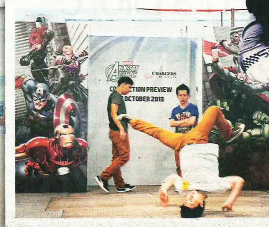
ANTARA aksi yang ditonjolkan pada pertunjukan fesyen Avengers Assemble di AEON Cheras Selatan baru-baru ini.