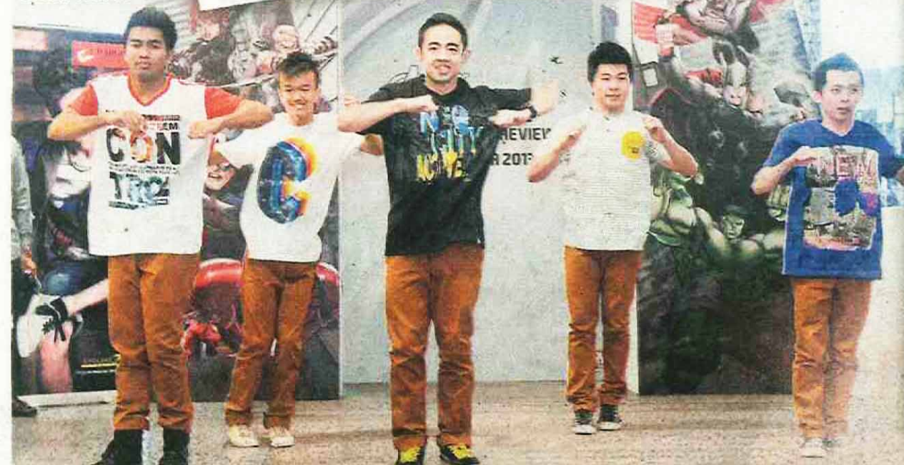
GOLONGAN remaja hari ini menggemari fesyen ikonografi khususnya yang mempamerkan watak-watak adi wira popular.

WATAK-WATAK adi wira Marvel Comics diletakkan dalam koleksi terbaharu Chargers Outfitters.